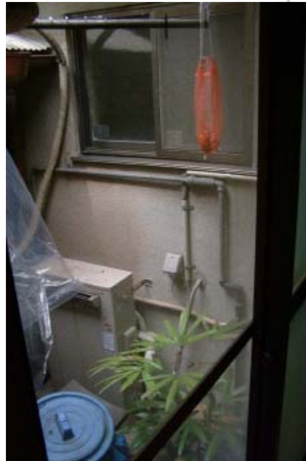
修繕前の中庭の様子