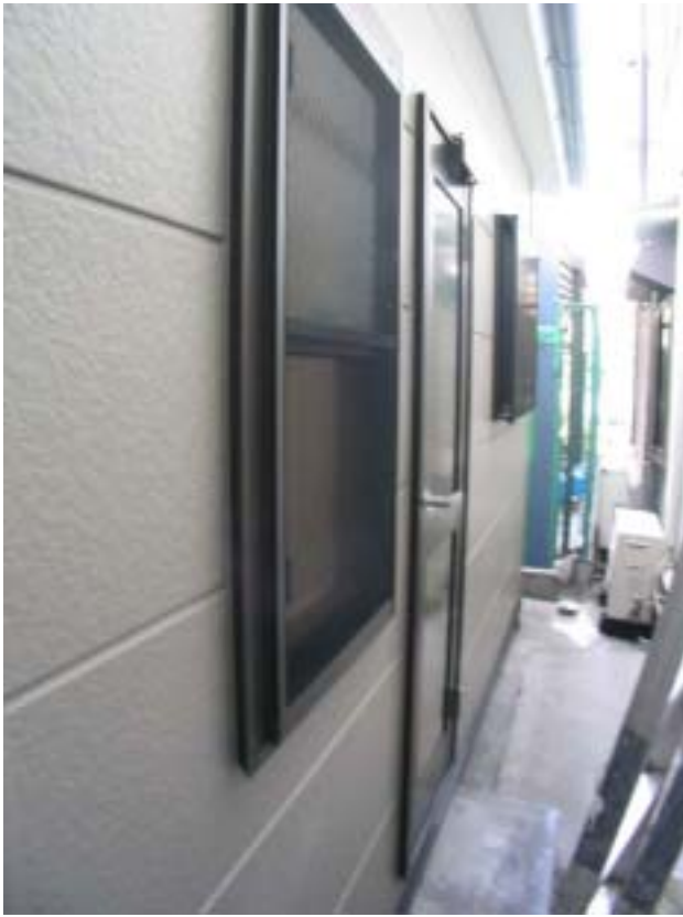
外壁にはサイディングを用い 通路への出入りもしやすくなった