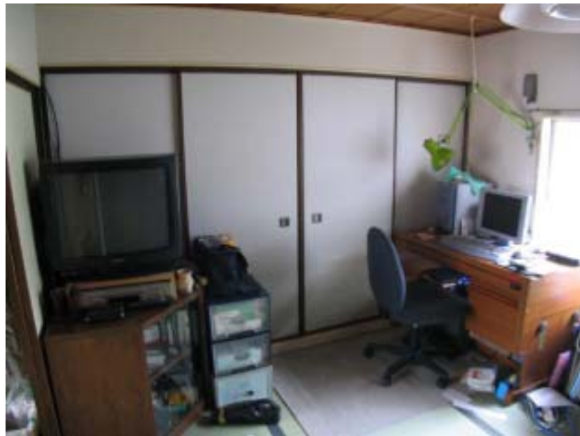
和室の畳を張り替え、 壁やふすまも張り替えた