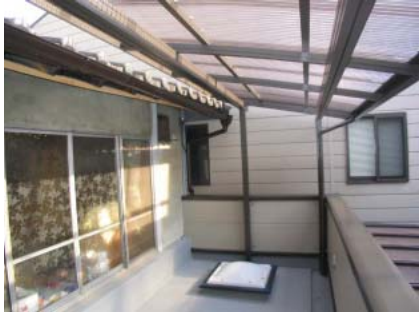
納戸のトップライト