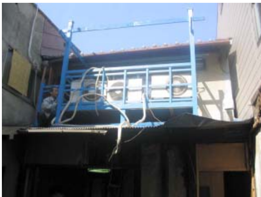
バルコニーも置いただけの 簡易なもので、2階廊下からの またぎ込みが高かった