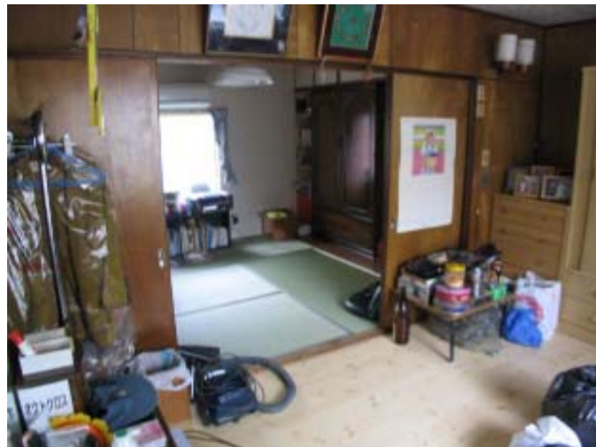
洋室はフローリングを張り替えた

DATA 建築主：M. M 設計・監理：こま設計堂（橋本 頼幸） 〒558-0013 大阪市住吉区我孫子東1-8-22-203 TEL(06)6696-0602 施工者：株式会社 永博（大場 正英） 〒530-0023 大阪市北区黒崎町3町7番 TEL(06)6371-5805 工期：2003年10月16日～12月13日