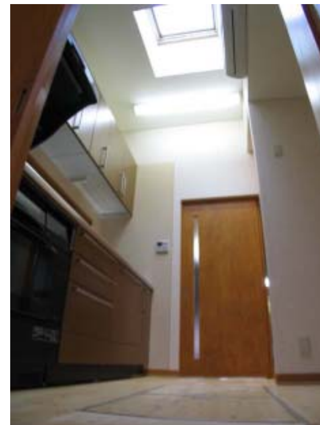
キッチンの上部に設けた天窗から明るい光が降り注ぐ