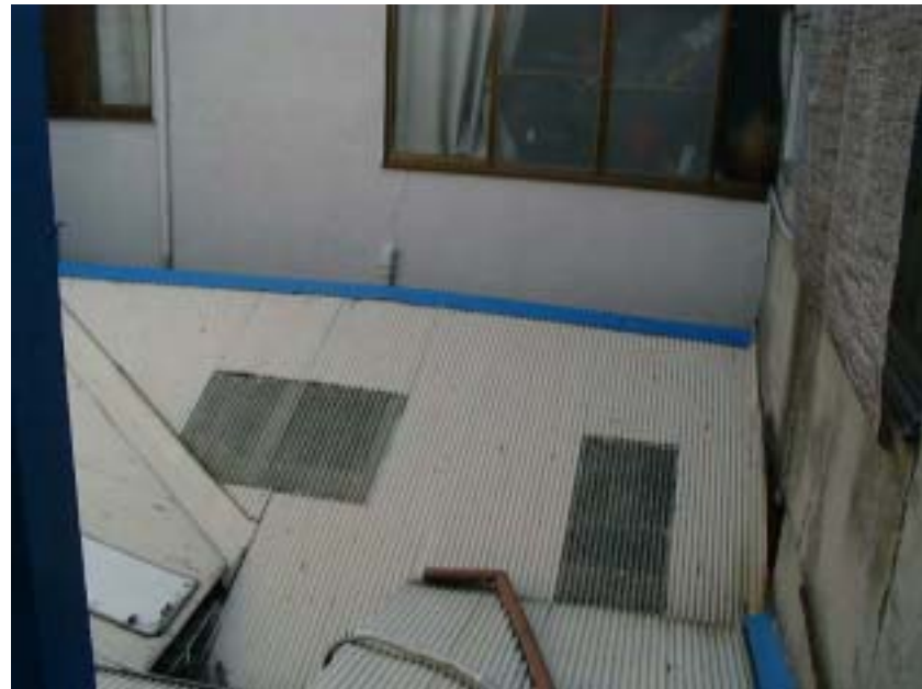
増築を繰り返した 木造平屋建てで小さな中庭が あり、トタン屋根だった