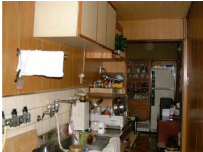
修繕前のキッチン