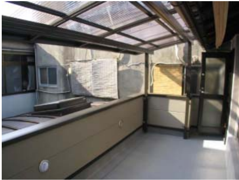
バルコニーも広くし 透明な屋根をかけた