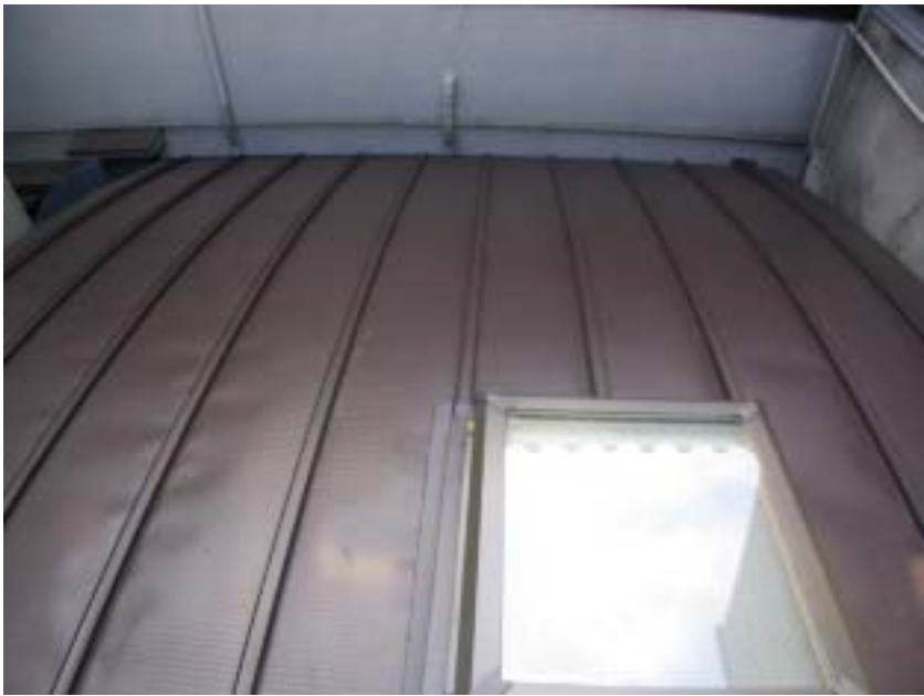
新しい建物は屋根を曲面にした