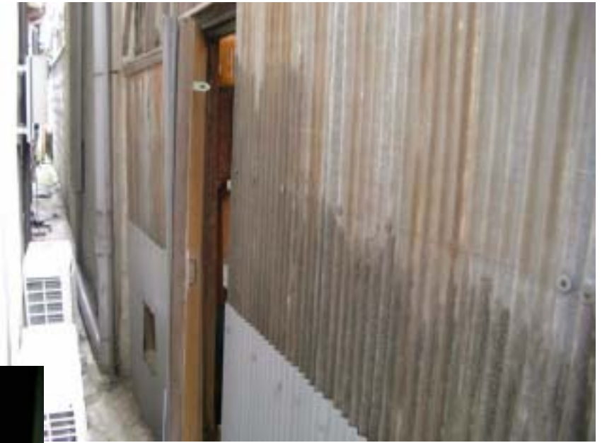
裏通路への出入りも簡易な扉で ほとんど出入りできなかった