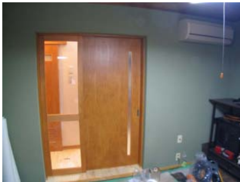
既存部分から新規建物への扉