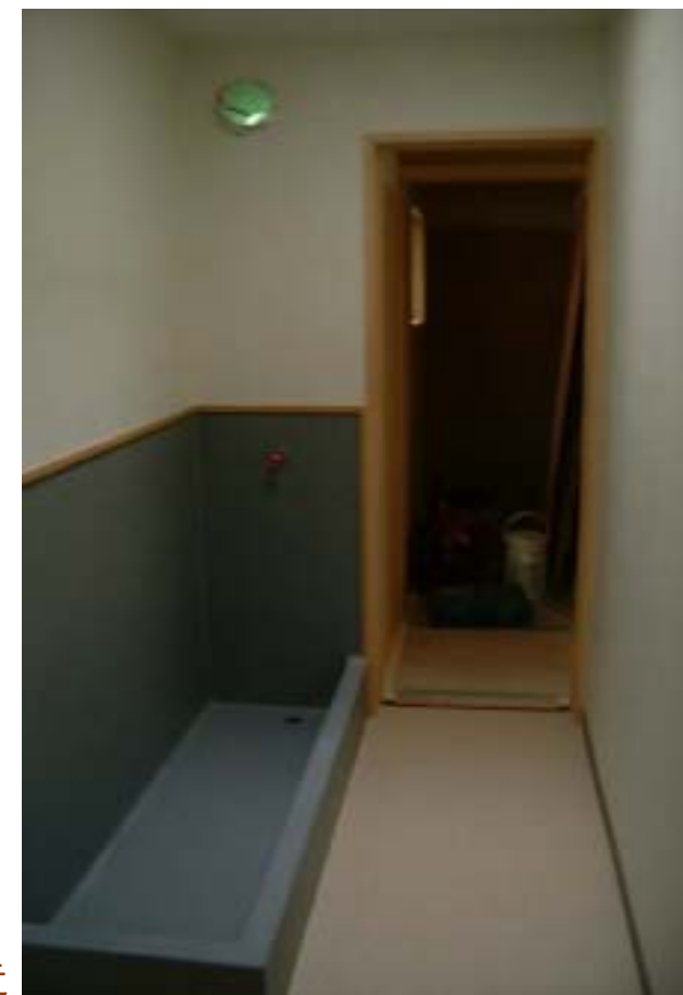
納戸にはご主人のこだわりの 漬け物樽を置くスペースを設けた