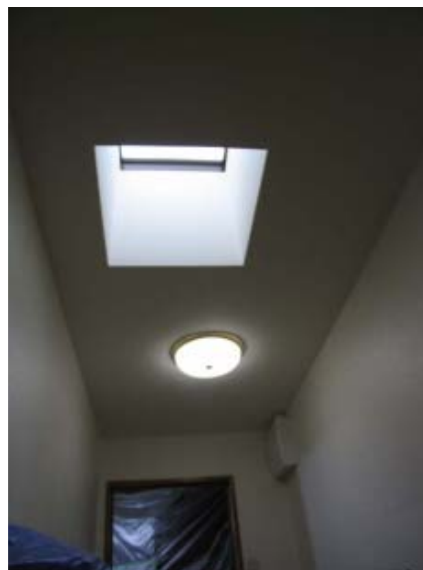
納戸に設けた天窗は取り外しができる 日中はほとんど照明がいらぬ