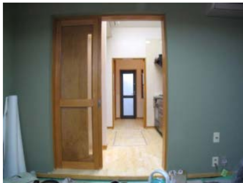
建物の奥まで見通せる