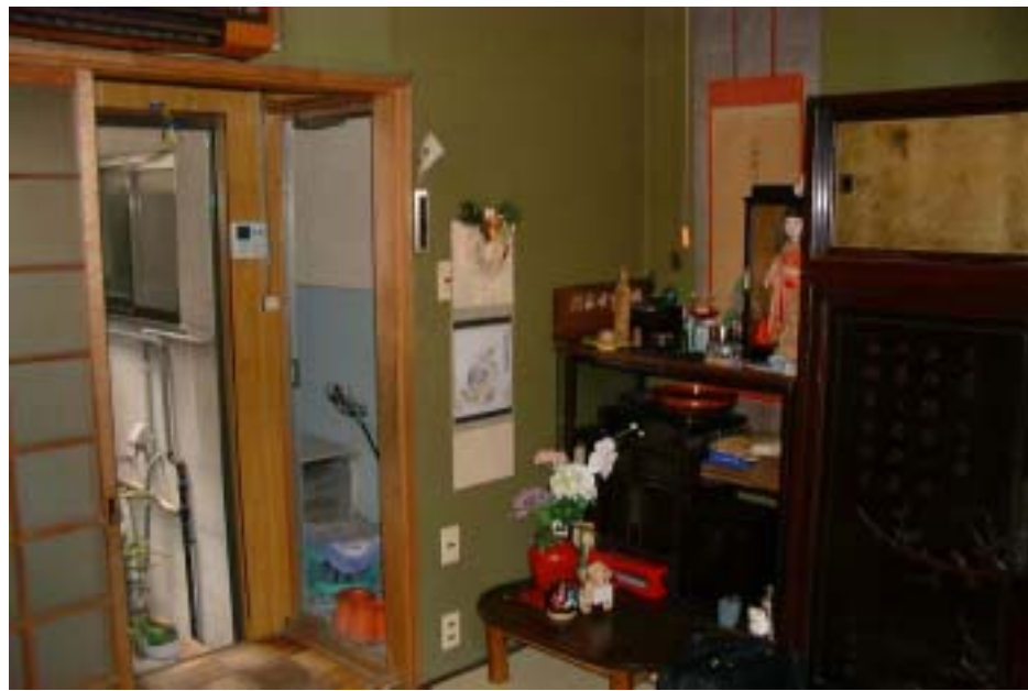
修繕前の和室 左奥が風呂