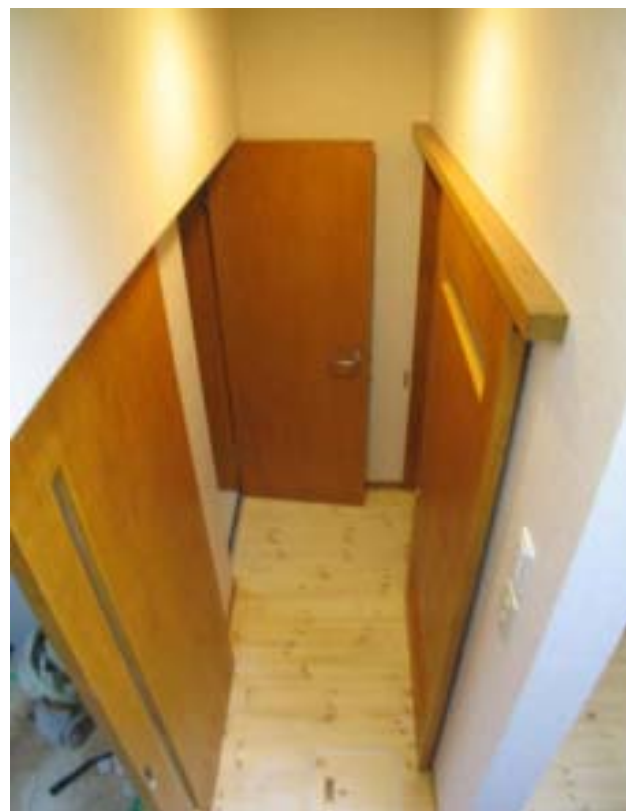
扉はすべて製作した