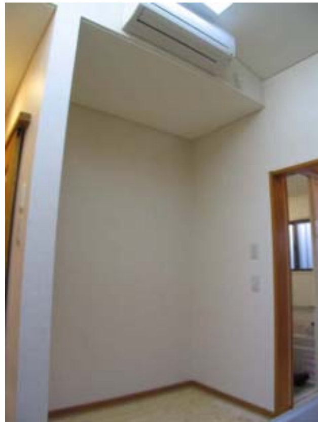
冷蔵庫・食器棚スペース